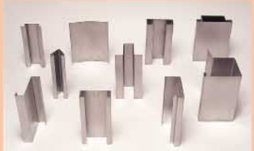
Pressopiegature e taglio lamiere

Lavori di curvatura tubi diam. 27-33-42-48-60