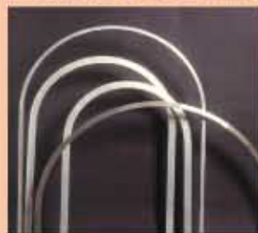
Archi per controtelai in acciaio e alluminio