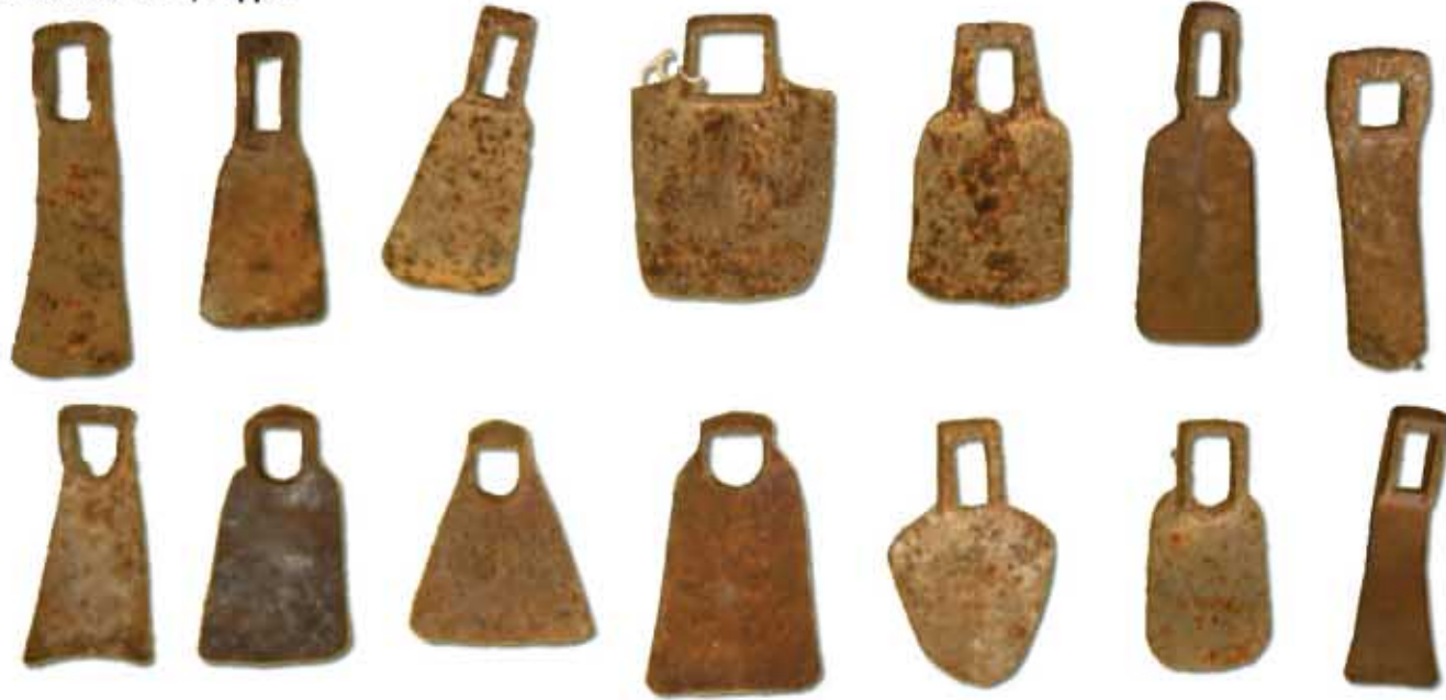
Collezione OMG, zappe.

RISCHI: Non far sapere alla mano destra quello che fa la sinistra, ma soprattutto non far fare anche alla sinistra quello che fai già benissimo con la destra.