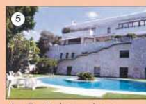
4•5 Veduta scala inox e parapetto cristallo blindato