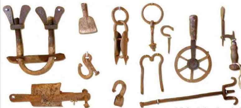
Collezione OMG, parti carro buoi.

MAL COMUNE: Che cosa hanno in comune tutti gli uomini che frequentano i locali per single? Sono sposati.