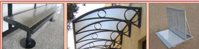
Panchina metrò Pensilina policarbonato Transenna antipanico