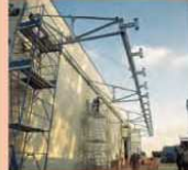
Struttura metallica sbalzo ad uso pensilina scarico carico deposito Regionale ENEL Macchiarèddu (CA)