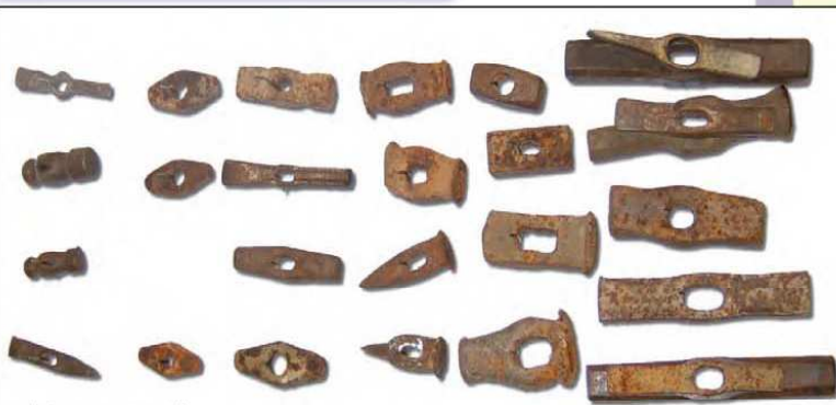
Collezione OMG, Martelli.

GRANDI PROMESSE: Quando mi hai conosciuto, mi hai cantato: «Un'ora sola ti vorrei...» Quando mi hai chiesto di uscire, mi hai cantato: «Un'ora sola ti vorrei...» Al nostro primo appuntamento, mi hai cantato: «Un'ora solo ti vorrei...» E allora, perché, quando finalmente te l'ho data, sei durato solo tre minuti?