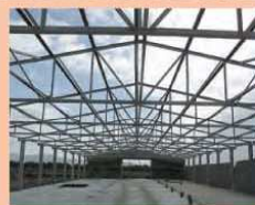
Struttura reticolare - S. Giovanni Suergiu