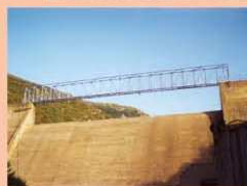
Passerella diga - Sinnai (CA)