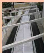
Pensilina metropolitana P.zza Repubblica Cagliari