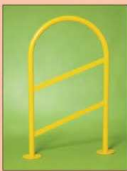
Dissuasori di sosta salvapedoni vari diametri di tubi