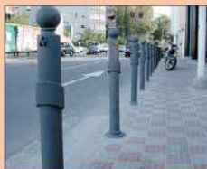
Dissuasori acciaio artistici